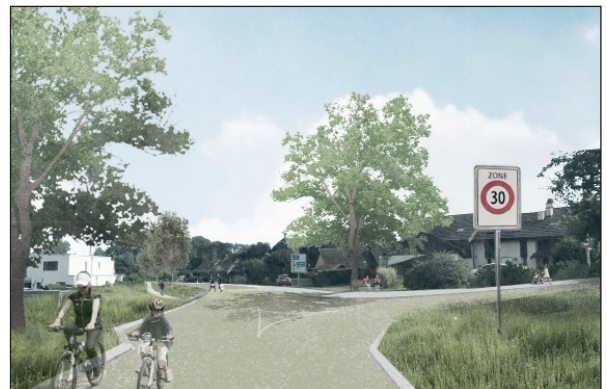
Photomontage de l'aménagement (Paysagestion)