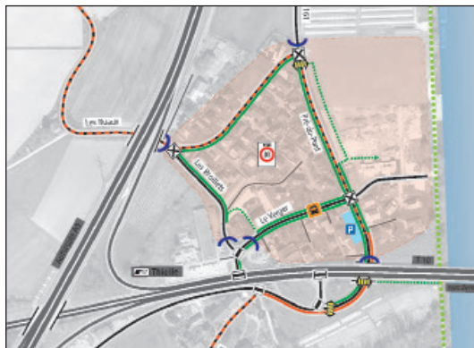
Vision et objectifs pour l'aménagement du bourg