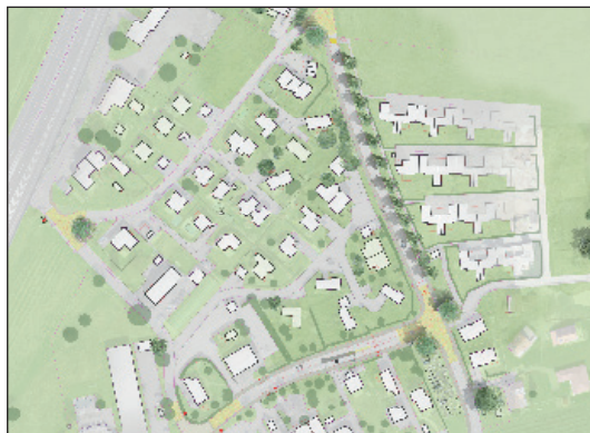
Esquisse d'Avant-Projet (C&G et Paysagestion)