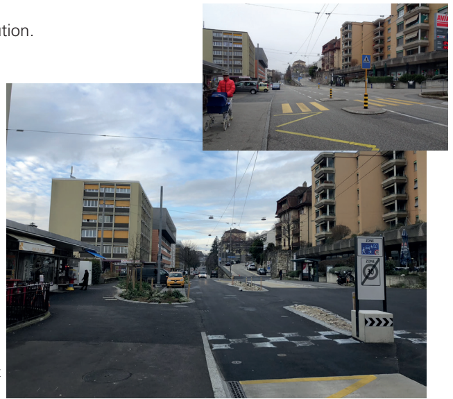
Place de la Rosière avant et après réaménagement (marquages encore manquants)